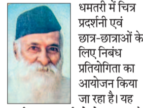
धमतरी में चित्र प्रदर्शनी एवं छात्र-छात्राओं के लिए निबंध प्रतियोगिता का आयोजन किया जा रहा है।